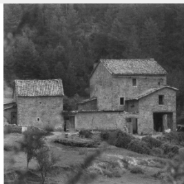
F - La Rota