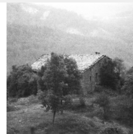
G - Masia Soldevila