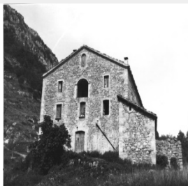
E - Les cases